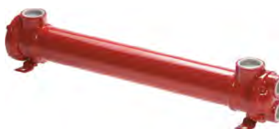
Marino · Marine